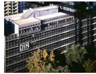
Berlin: Deutsches Institut für Normung